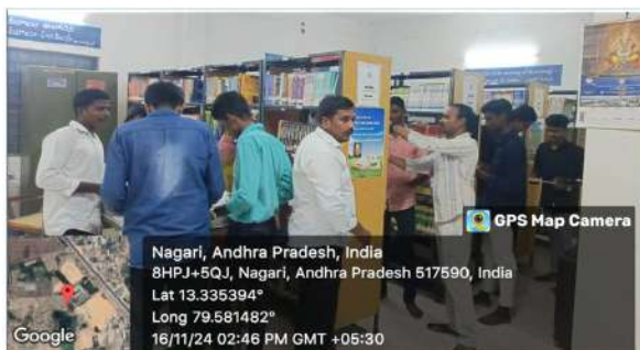
Library Tour (16.11.2024)