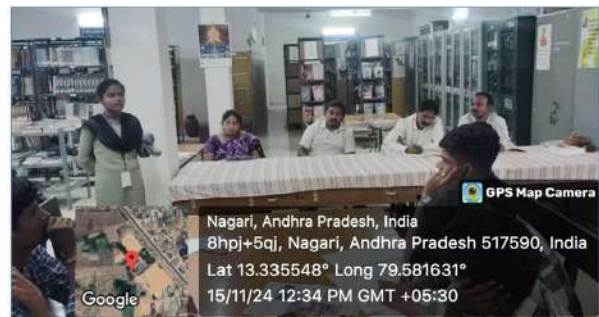
Debate Competition (15.11.2024)