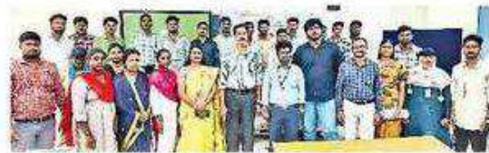
ఎంపికైన విద్యార్థులతో ప్రిన్సిపల్, అధ్యాపకులు

20/11/2024 | Chittoor(Nagari) | Page : 9