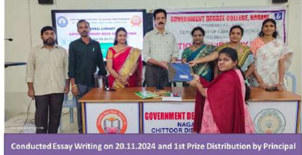
Conducted Essay Writing on 20.11.2024 and 1st Prize Distribution by Principal