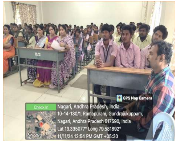
Staff and students participation in the programme