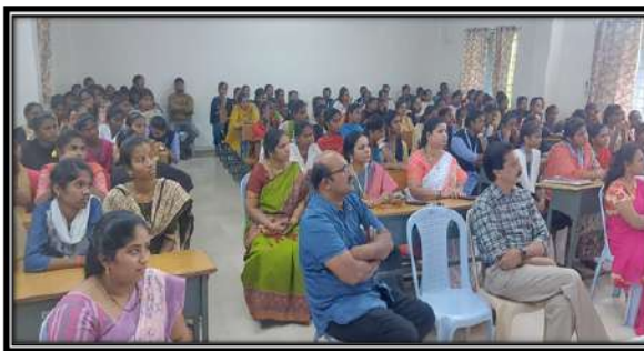
Participants of the programme