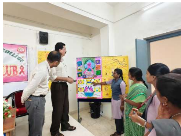
Oath taking and Poster presentation by the students