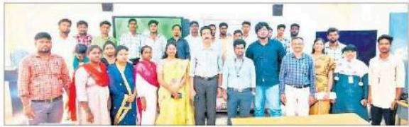
ఉద్యోగాలకు ఎంపికైన అభ్యర్థులతో సంస్థల ప్రతినిధులు