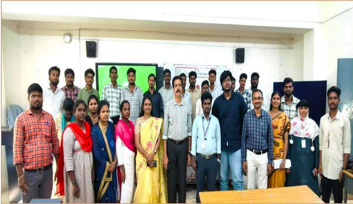
Selected candidates with the Principal, Vice Principal, company HR's and JKC team