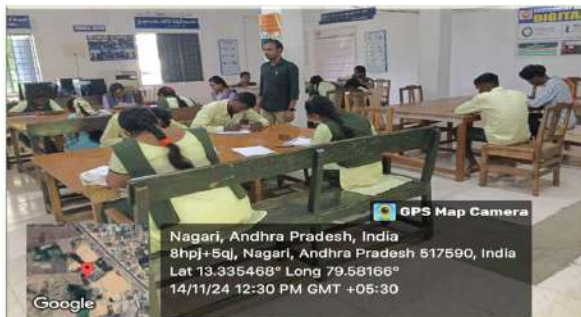
Essay Writing Competition (14.11.2024)