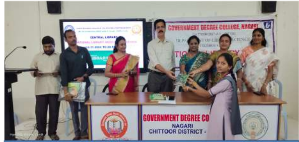
Conducted Essay Writing on 20.11.2024 and 2nd Prize Distribution by Principal