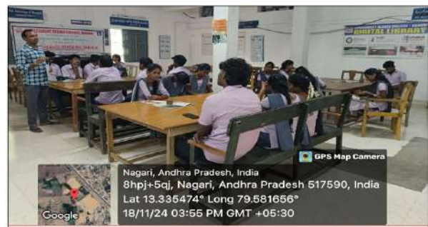
Quiz Competition (18.11.2024)